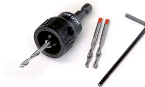
GEREEDSCHAP - COBRA® SMART-BIT