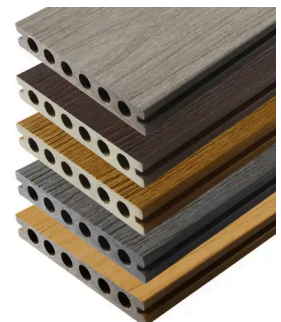
TERRASPLANK PREMIUM (RHK) 22,5X138MM